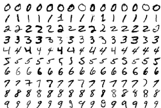
FIGURE 3 – Jeu de données MNIST.

Pour finir, vous pouvez appliquer votre code au jeu de données MNIST. MNIST est un jeu d'images de chiffres manuscrits (voir figure 3), il y a donc 10 classes ( n_y = 10 ). Les images font 28 \times 28 pixels, mais elles seront représentées comme un vecteur de 784 valeurs. Pour utiliser ce jeu de données, utilisez la classe MNISTData qui fonctionne comme la classe CirclesData sans la grille de points et les fonctions d'affichage.